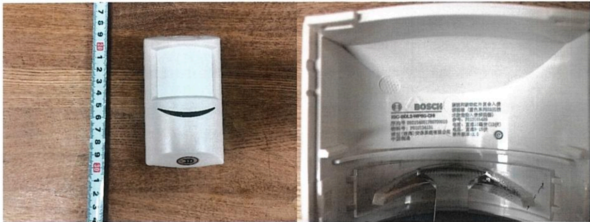
图一: ISC-BDL2-WP6G-CHI 型微波和被动红外复合入侵探测器 (蓝色系列 G2 三技术防宠物入侵探测器) 外观结构、标识