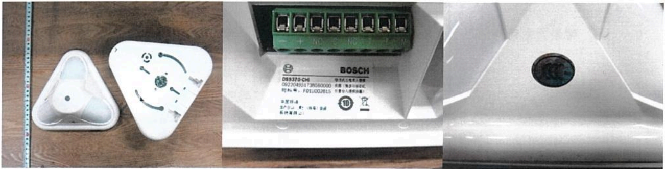
图一: DS9370-CHI 型吸顶式三技术入侵探测器 (微波与被动红外复合入侵探测器) 外观结构、标识及 3C 标志